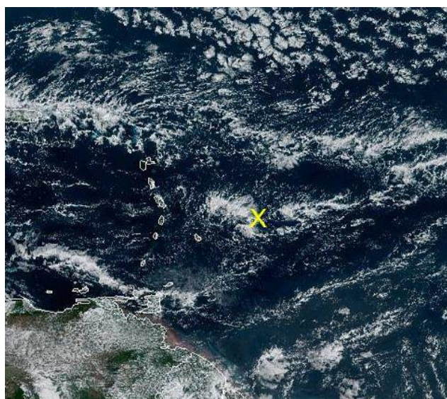
Satellitenbild GOES 20.01.2020 13:30 UTC

Ost bis Nordost 4 bis 5 Bft etwas abnehmend 4 Bft , Regenschauer, sonst gute Sicht, See mit Dünung um 2 Meter abnehmend 1.5 bis 2 Meter, Dünung 2 Meter abnehmend.